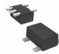
DMC562050R Panasonic Electronic Components TRANS 2NPN PREBIAS 0.15W SMINI5