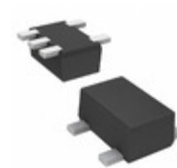
DMC562000R Panasonic Electronic Components TRANS 2NPN PREBIAS 0.15W SMINI5