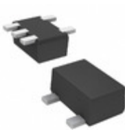
DMC5610N0R Panasonic Electronic Components TRANS 2NPN PREBIAS 0.15W SMINI5