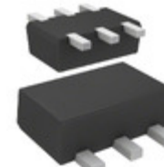
DMG564050R Panasonic Electronic Components TRANS PREBIAS NPN/PNP SMINI6