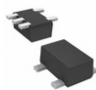
DMG563020R Panasonic Electronic Components TRANS PREBIAS NPN/PNP SMINI5