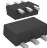
DMG564030R Panasonic Electronic Components TRANS PREBIAS NPN/PNP SMINI6